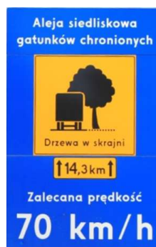
Rys. 2. Przykładowa tablica informacyjna o powodach zalecanej prędkości na drodze

Oznakowanie nie może ograniczać skrajni drogowej.